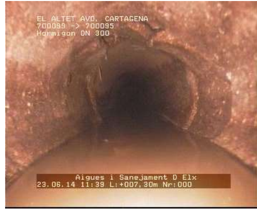
Estado de la red de alcantarillado