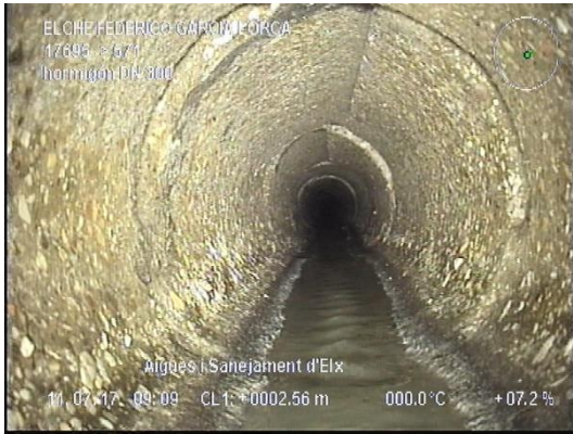
Fisura en clave