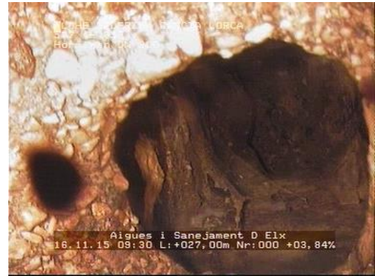
Oquedad por rotura en clave